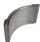
Верхняя броня турбины